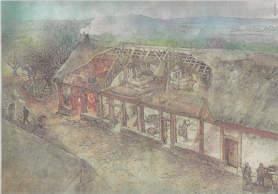
▲ Siglo XI. De las primeras viviendas con cimientos de piedra, como la de la imagen, hay restos arqueológicos documentados.