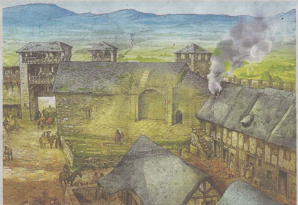
▲ Siglo XII. La construcción de la muralla, que hizo importante a la población, comenzó a finales del siglo anterior.